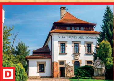
Galéria súčasného umenia „Dwór Karwacjanów“ v Gorliciach