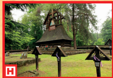
Cintorín z 1. svetovej vojny v Magure Małastowskiej