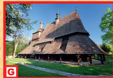
Kostol sv. Filipa a Jakuba v Sękowej, UNESCO