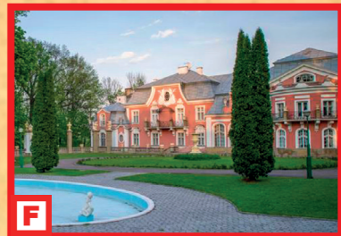
Palác Długoszków v Siary